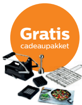
Frietsnijder / Ei-onttopper / Toststrekje / Mini Receptenboekje